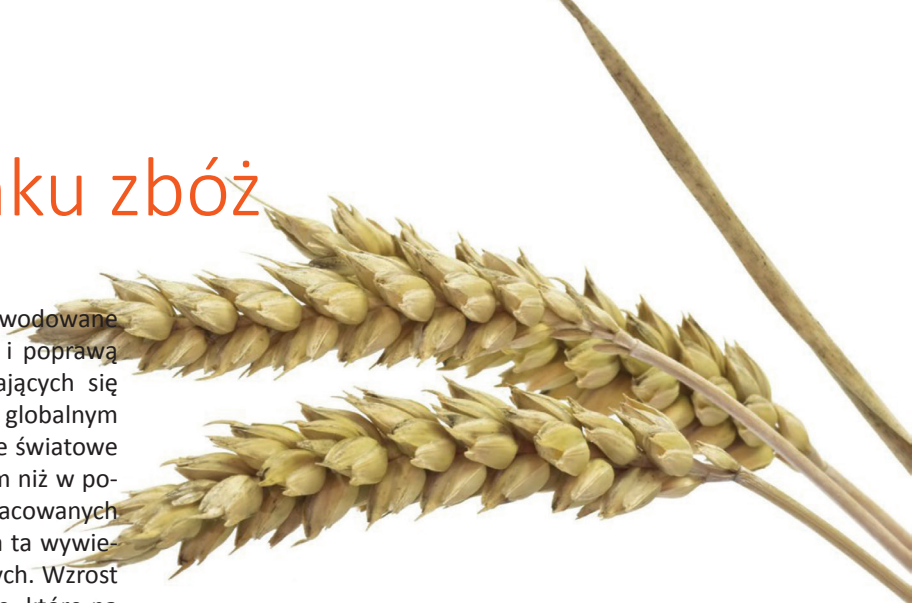
Rynek zbóż w Polsce - zbiory i handel zagraniczny*