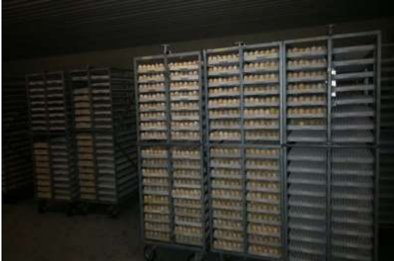
Ferma – produkcja – zbiór, dezynfekcja, magazynowanie