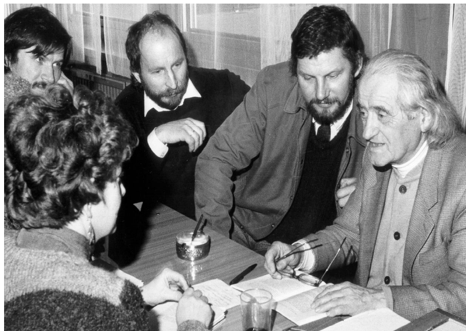
Pionierzy rolnictwa ekologicznego