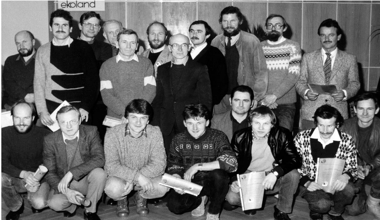
Grupa pierwszych rolników ekologicznych z atestem Ekolandu (1990 rok).